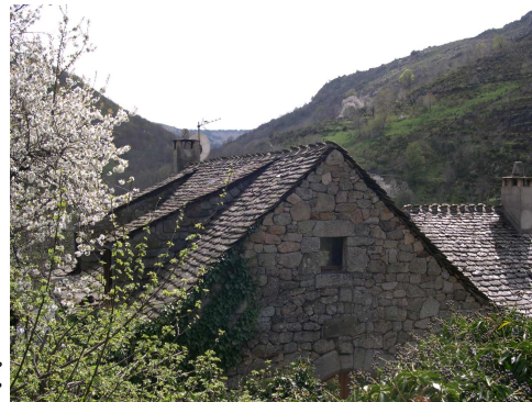
Derrière une souche de cheminée

J'essaie de trouver un endroit peu visible du domaine public et j'évite les implantations systématiques en pleine façade et sur le toit.