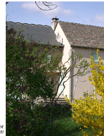
Dans un décrochement du bâti