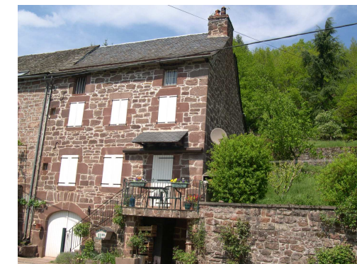
Derrière un écran végétal

Il peut aussi être judicieux d'étudier la possibilité de poser une antenne collective dans un immeuble ou entre voisins d'habitations particulières.