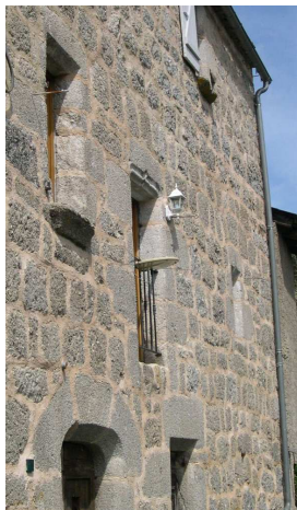
Antenne « plateau »

Il peut aussi être judicieux d'étudier la possibilité de poser une antenne collective dans un immeuble ou entre voisins d'habitations particulières.